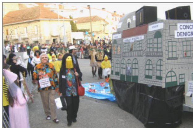
Comparsa de Chandebrito e Priegue do Entroido de Nigrán 2008.

Construíron unha carroza representando á casa do Concello, e baixo o título "Pola herencia do tío Pepe estamos a velas vir", pasearon polas rúas de Panxón representando os males que afectan ao Concello.