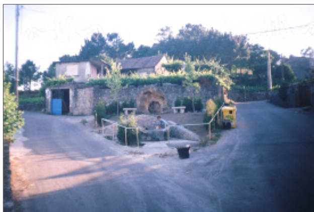
Foto da fonte despois de ser reformada.