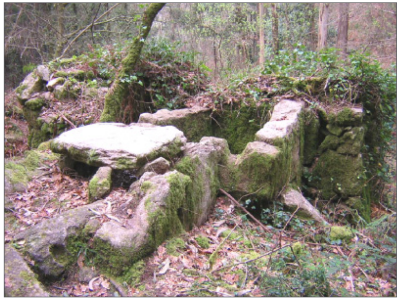
Muíño das Loureiras, (s. XVIII), un dos oito da parroquia sen inventariar.

Consideramos transcendental a elaboración dun PXOM de Nigrán dentro do máximo respecto a ese patrimonio, para o cal esta asociación estará presente no Consello Sectorial, para o que xa recibiu asesoramento. Hai diversos asuntos que se deben resol-