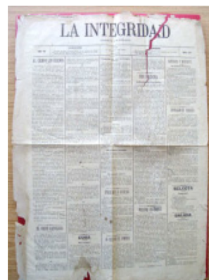
Periódico "La Integridad".

Hai pouco tempo soube-mos que nos anos 80 se descubriu, na Casa Rectoral de Chandebrito, parte dun exemplar dun diario católico editado en Tui denominado "La Integridad", datado no 13 de maio de 1895 e que aínda se conserva, que ten un poema de Rosalía de Castro. Pertenceu ao cura párroco Manuel A. Fernández, o mesmo que aumentou e reparou a Igrexa parroquial.