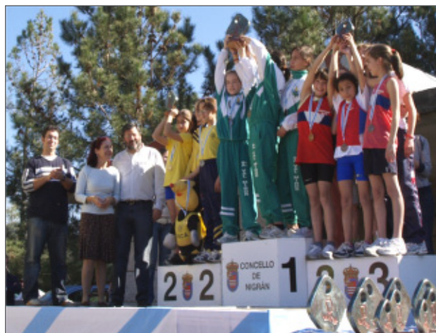
A Sociedade do Val Miñor conqueu varios premios.