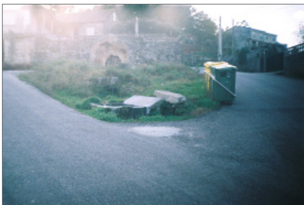
Foto da fonte antes da reforma do ano 2004.