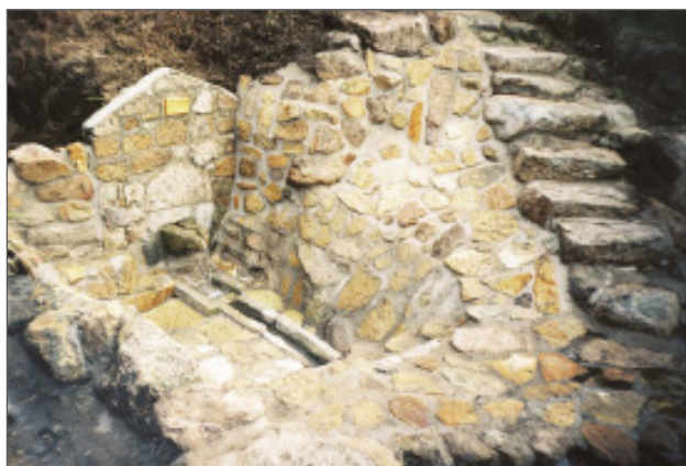
Foto da fonte tomada no ano 2005.