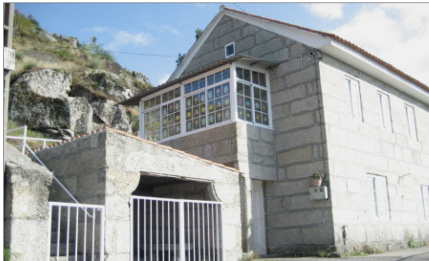
Escola de Educación Infantil de Chandebrito.

Teño solicitado un encerado dixital na Consellería para o ano que vén e me dixeron que probablemente nolo dean. Neste curso realizamos varias excursións: en outubro visitamos un muíño de Chandebrito e recolleemos follas no monte. Tamén visitamos a Biblioteca de Ceán en Nigrán, onde