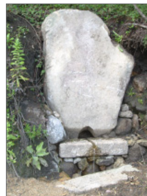
Fonte do Cocho de Abaixo.

Destá maneira son xa catorce as fontes de uso público coas que conta o pobo de Chandebrito.